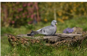
Arjan van Dijk