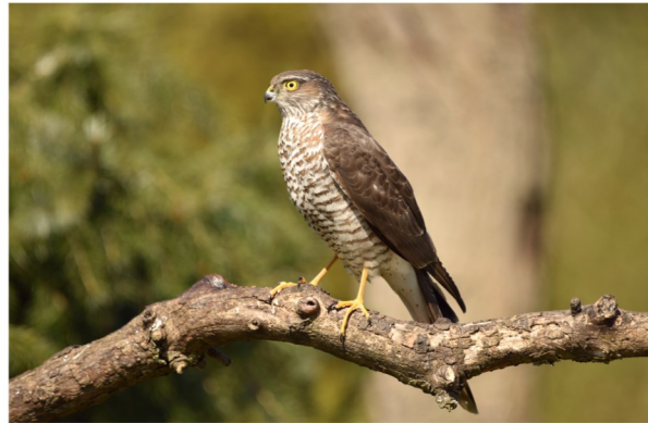
Joop vd Ouweland